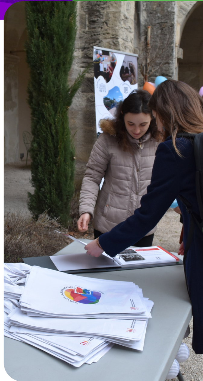
Afterwork de la promotion 2021-2022

Par sa singularité, la Jeune Agence Muséocom est ainsi un dispositif unique en son genre, aidant les étudiant-es à prendre confiance en eux·elles, tant au niveau personnel que professionnel.